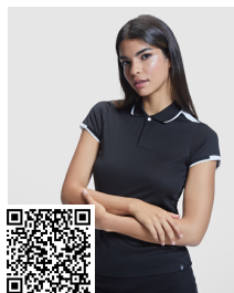
TAMIL WOMAN PO0409